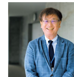
高校生 チャレンジグルメ コンテスト実行委員会 会長

今回のコンテストが、皆さんのアイデア満載、美味しさたっぷりの商品で互いに競い合い、さらに良き仲間、良き思い出づくりの場となることを心から願い、実行委員会会長からのメッセージとします。