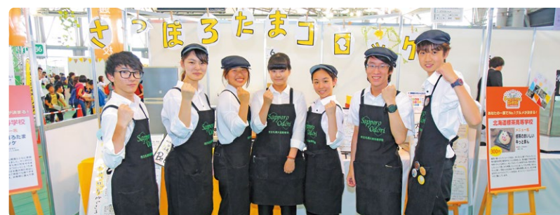
※第8回は、コロナ禍のため中止しました。