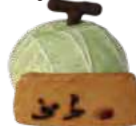
ふらの大地の恵みムースメロン

北海道富良野緑峰高等学校は、2017年10月のチャレンジグルメコンテストに初めて出場しました。参加する生徒は誰も商品開発をしたことがなく、何もわからないゼロからのスタート。まずは農家やワイン工場などを見学して、富良野の特産について知識を深めました。そこから自分たちでスイーツのアイデアを何案も出し、地元飲食店の方々の協力でのアイデアが形になって「ふらの大地の恵みムースメロン」が生まれました。その名の通り、メロンの緑を表現するほうれん草パウダー、スポンジの牛乳、卵に至るまで、原料はほとんど富良野産。特に果肉のメロンは、夏時期よりも栽培するのが難しい「秋メロン」を使用。高級品ですが、規格外などを提供してもらったことで原価を抑えることができました。これからもきちんと売れるよう原価率にもこだわったムースメロンは、地元の菓子店で季節限定商品として毎秋、店頭で並べられることになっています。