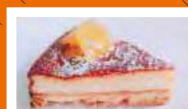
北海道砂川高等学校