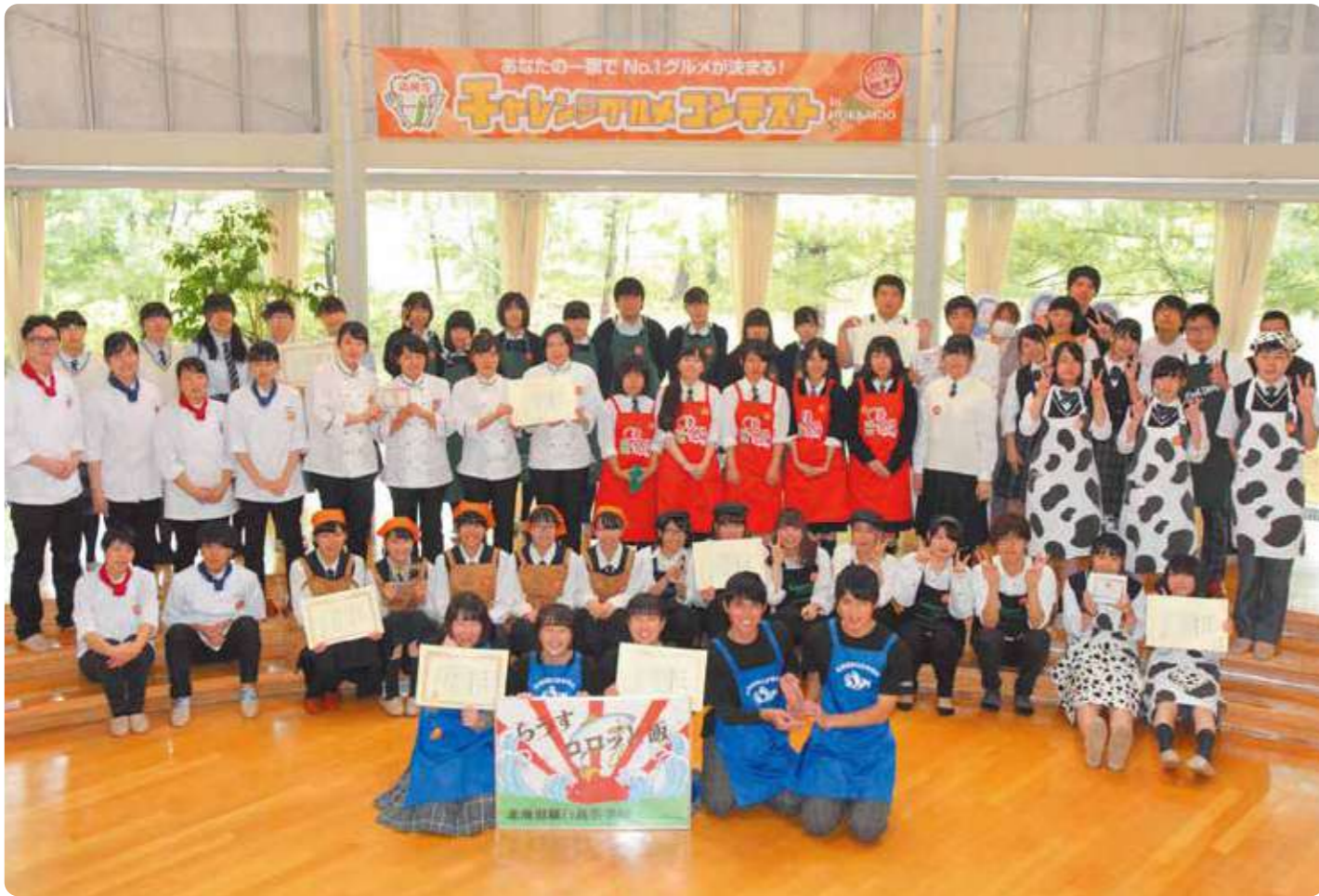
昨年のファイナリストのみなさん