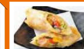
北海道千歳高等学校