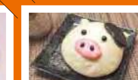
北海道標茶高等学校