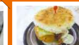
北海道帯広南商業高等学校