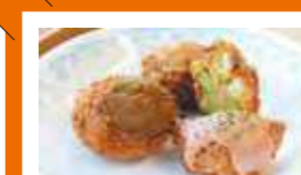
市立札幌大通高等学校