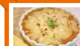
北海道平取高等学校