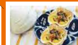
北海道霧多布高等学校