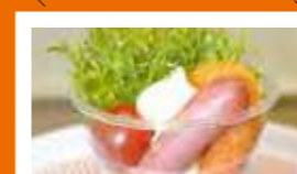
北海道北見北斗高等学校