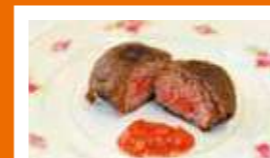
北海道浦河高等学校