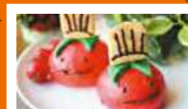
富良野緑峰高等学校